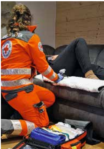
Hier wird ein Patient zu Hause versorgt.

Die BRK Bereitschaft Waltenhofen hat die Gruppe zum Jahresbeginn neu gegründet. Sie ist mit ihren zwölf Mitgliedern bereits gut aufgestellt: Acht davon arbeiten hauptamtlich im Rettungsdienst oder in der Integrierten Leitstelle und sind nun bereit, als professionelle Ersthelfer auch in ihrer Freizeit Hilfe zu leisten. Vier weitere Mitglieder sind im Rahmen ihrer ehrenamtlichen Tätigkeit beim Roten Kreuz als Rettungs- bzw. Fachsanitäter ausgebildet und stellen sich ebenfalls in den Dienst für Niedersonthofen und Umgebung.