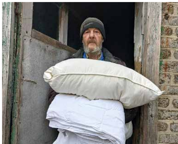
Eine Spende, die ankommt: Warme Decken und Kissen

Öffnungszeiten: samstags von 9 bis 12 Uhr in Sulzberg, Ried 8; Info-Telefon ab 15 Uhr: 0171/9510445.