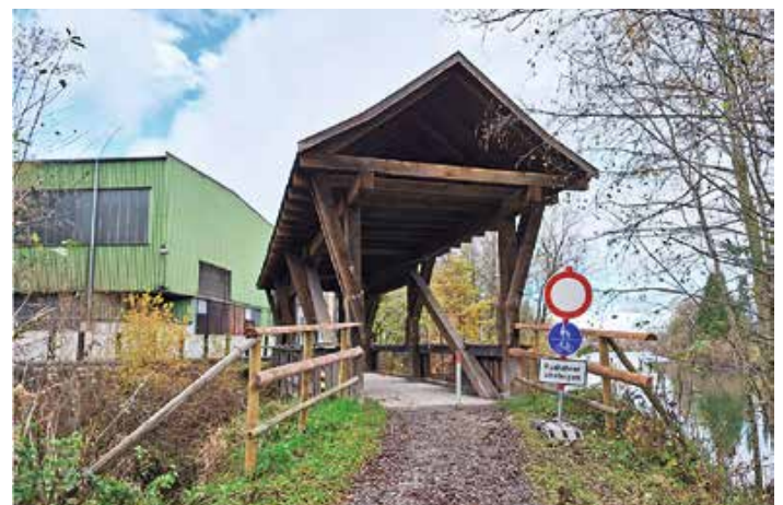
Lageplan/Bild: Wasserwirtschaftsamt Kempten