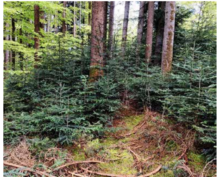
Bild: : Ein zukunftsfester Mischwald entsteht, wenn der Baumnachwuchs, wie diese kleinen Tannen, eine Chance hat, zu wachsen.

https://www.aelf-ke.bayern.de/forstwirtschaft/jagd/263766/index.php