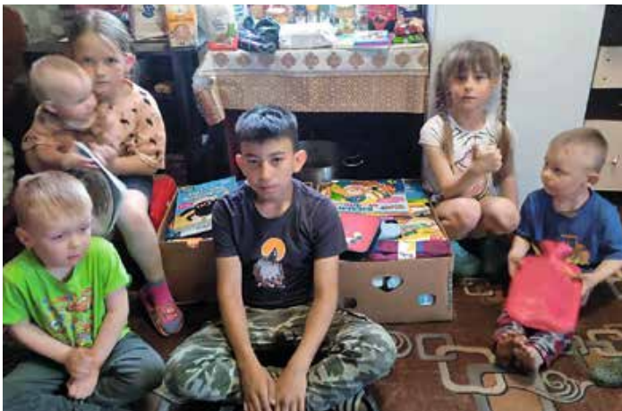
Alle Kinder der Familie Luda aus Charkiw freuen sich über die Lebensmittel, Buntstifte und Malbücher.