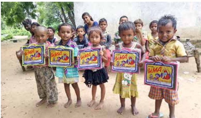
Steyler Missionare kümmern sich in "Vikas Deepti" um Kinder mit Behinderungen.