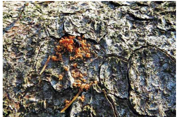
Der Borkenkäferbefall kann frühzeitig am rot-braunen Bohrmehl erkannt werden.