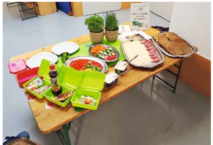
Abbildung 1 Pausenbox Station

Das AELF Kempten hat für das zweite Halbjahr 2024 noch Kapazität für weitere Einrichtungen, die an den Frühstückstagen teilnehmen möchten. Sprechen Sie Ihre Einrichtungen direkt an oder wenden Sie sich an die Netzwerkkordinatorin am Amt für Ernährung, Landwirtschaft und Forsten Kempten, Tamara Briegel 0831-526131219 Tamara.briegel@aelfke.bayern.de