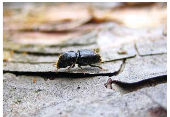
Der nur wenige Millimeter große Buchdrucker kann ganze Fichtenwälder vernichten.